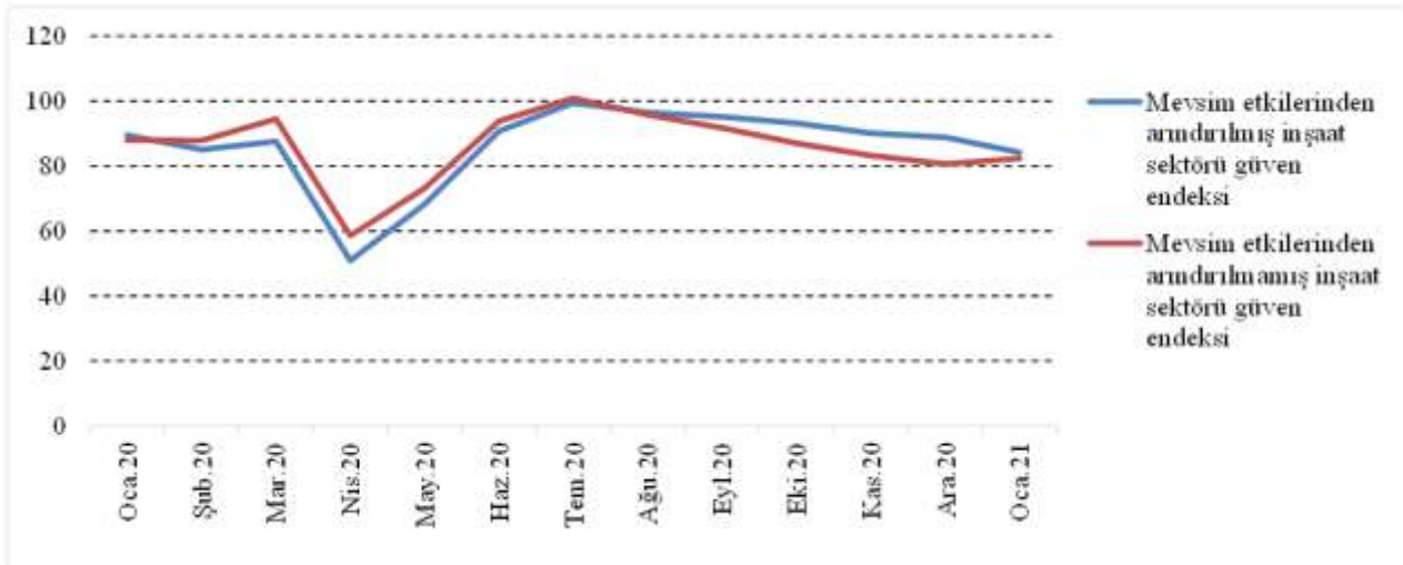
Şekil : İnşaat Sektörü Güven Endeksi (Ocak 2020 – Ocak 2021)

Mevsim etkilerinden arındırılmamış inşaat sektörü güven endeksine bakıldığında ise 2021 yılı Ocak ayında bir önceki aya göre 1,7 puan artarak 82,3 puana yükseldiği görülmektedir. 2020 Ocak ayı verilerine göre incelendiğinde ise yüzde 6,4 oranında azaldığı gözlemlenmektedir.