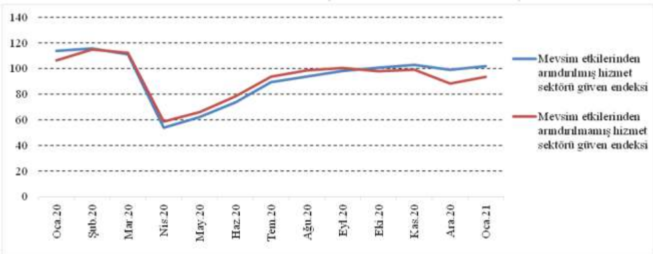
Şekil 2: Hizmet Sektörü Güven Endeksi (Ocak 2020 – Ocak 2021)

Mevsim etkilerinden arındırılmamış endeks ise, 2020 yılının Aralık ayına göre yüzde 5,9 oranında artarak (5,2 puan) 93,5 olurken, 2020 yılı Ocak ayına göre yüzde 12,0 oranında (12,8 puan) azalmıştır.